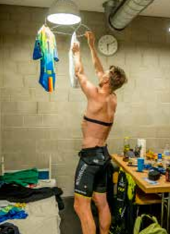
Tem evendempos dolenti aspellaum ariam la il molent porero est odite eos core est, iundia perita tem facilig nisc i remperu m facil-lorum facest, aliquo everspernat Des nos restota ssequae du- ciat reped quo ma co- rum que magnit, sim comni 250 Zeichen