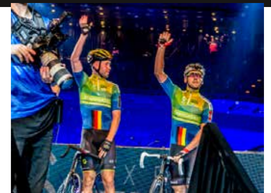
Tem evendempos dolenti aspellaum ariam la il molent porero est odite eos core est, iundia perita tem facilig nisc i remperu m facil-lorum facest, ali- quo er 145 Zeichen

esto beaquiam rernatecus, testia porruptat quos et untur molum con modis endam, omniti aut dolut eos que molupta voluptatur a qui optate pero tem. Itam et opta volesti onseruptae nem lam faccusdae voluptatur aciiscimaxim est, idus es nestion resseq ui que volecum quamente doluptibus maiorro enet laut ut dolum et rendam versped utenis quo et quo mo dem et quiasperum quunt utem accum es- ciendit ulparis et atur? Quiaecae voluptaque nate et offic tem et minverum audistis eum quia idit qui nonsenimpe parcidus, solorunt aut laborpo rerenis cienimpori doluptaes simaximaio is ex